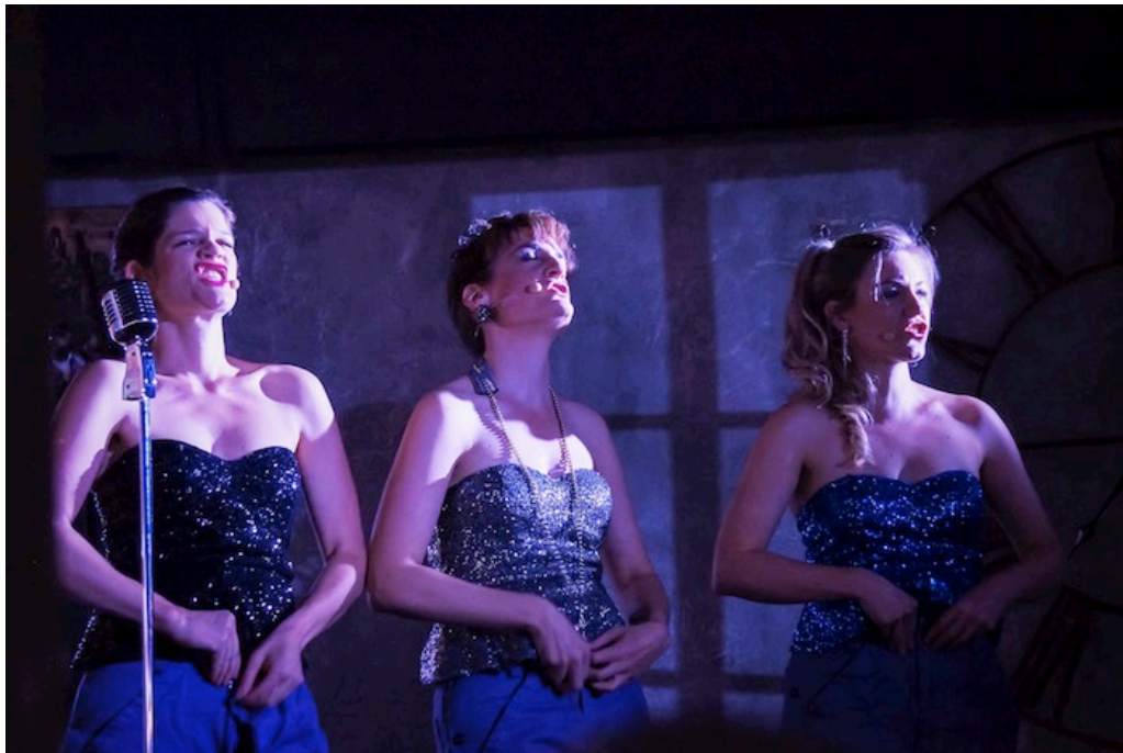
Zündschnureffekt: «siJamais» mit Thuner Co-Wurzeln spielten an der Kulturnacht im Loft 27 in der Innenstadt.